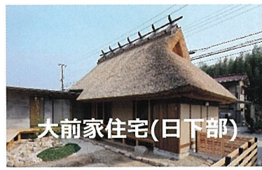
大前家住宅(日下部)